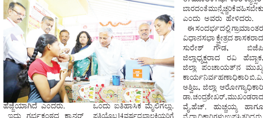
ಹೆಚ್.ಪಿ.ವಿ. ಲಸಿಕಾ ಅಭಿಯಾನಕ್ಕೆ ಸಚಿವ ಸೋಮಣ್ಣ ಚಾಲನೆ ನೀಡಿದರು.

ತುಮಕೂರು, ಜೂ.1- ತಾಲ್ಲೂಕಿನ ಮಲ್ಲಸರದ ಪ್ರಾಥಮಿಕ ಆರೋಗ್ಯ ಕೇಂದ್ರದಲ್ಲಿ ಹೆಚ್.ಪಿ.ವಿ. ಲಸಿಕಾ ಅಭಿಯಾನ-2026ಕ್ಕೆ ಕೇಂದ್ರ ಜಲಶಕ್ತಿ ಹಾಗೂ ರೈಲ್ವೆ ಖಾತೆ ರಾಜ್ಯ ಸಚಿವ ವಿ. ಸೋಮಣ್ಣ ಚಾಲನೆ ನೀಡಿದರು. ನಂತರ ಮಾತನಾಡಿದ ಅವರು, ಭಾರತದ ನಾರಿ ಶಕ್ತಿಯನ್ನು ಸಬಲೀಕರಣಗೊಳಿಸುವ ಮತ್ತು ದೇಶಾದ್ಯಂತ ಗಾಂಧಿಯ ಮತ್ತು ಹೆಣ್ಣು ಮಕ್ಕಳ ಆರೋಗ್ಯವನ್ನು ಕಾಪಾಡುವ ನಿಟ್ಟಿನಲ್ಲಿ ಹೆಚ್.ಪಿ.ವಿ ಲಸಿಕಾ ಅಭಿಯಾನ ಒಂದು ಪ್ರಮುಖ